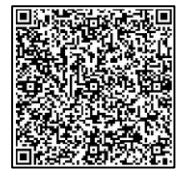
Datum Bangkok, 17.12.201414