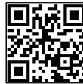
Unser Zeichen 4Wheel.travel

Facebook: www.facebook.com/4wheel.travel Google + : https://plus.google.com/+4x4ReisenDE/posts web/mail: www.4wheel.travel / thailand@4wheel.travel Tel. : +66 (0) 81 86 84 708 / +49 (0) 30 868709401