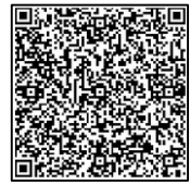
Datum Bangkok, 19.12.201414