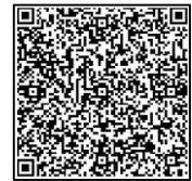
Datum Bangkok, 19.12.201414